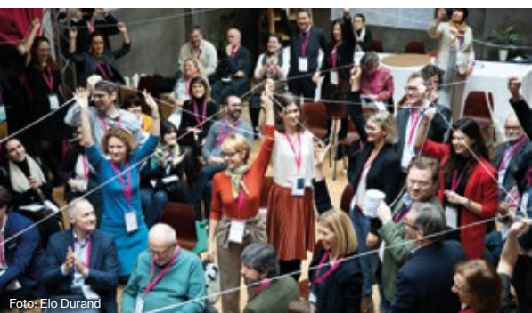
Teilnehmer*innen des ersten PEX-Forums von DAFNE

Die ECFI ist eine Multi-Stakeholder Initiative, die das Ziel verfolgt die Bürgerstiftungsbewegung in Europa durch wechselseitiges Lernen, Vernetzen und Bewusstseinsbildung zu stärken. ECFI wird vom Bundesverband Deutscher Stiftungen in Zusammenarbeit mit dem Center for Philanthropy in der Slowakei getragen.