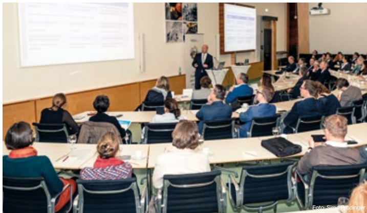
Die von EcoAustria erstellte Studie wurde in Kooperation mit der Industriellenvereinigung präsentiert.

Mitte Mai hat der Verband eine Studie präsentiert, die belegt, dass jährlich 35 Millionen Euro mehr für Bildungsprojekte ausgeschüttet werden könnten. Voraussetzung dafür wäre die Ausweitung der Spendenabsetzbarkeit auf Bildung und damit Chancengleichheit mit anderen spendenbegünstigten Zwecken. Die Bemühungen fruchten! Diese Forderung wurde ins aktuelle Regierungsprogramm aufgenommen.