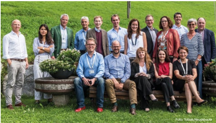
Gruppenfoto vom ersten Intensivlehrgang für Führungskräfte in Alpbach

In diversen Veranstaltungsformaten gab es die Möglichkeit von Best Practices zu lernen, mit anderen philanthropischen Akteuren ins Gespräch zu kommen und konkrete Ideen zu entwickeln - bei diesen Angeboten begegneten sich 2019 knapp 300 Personen!